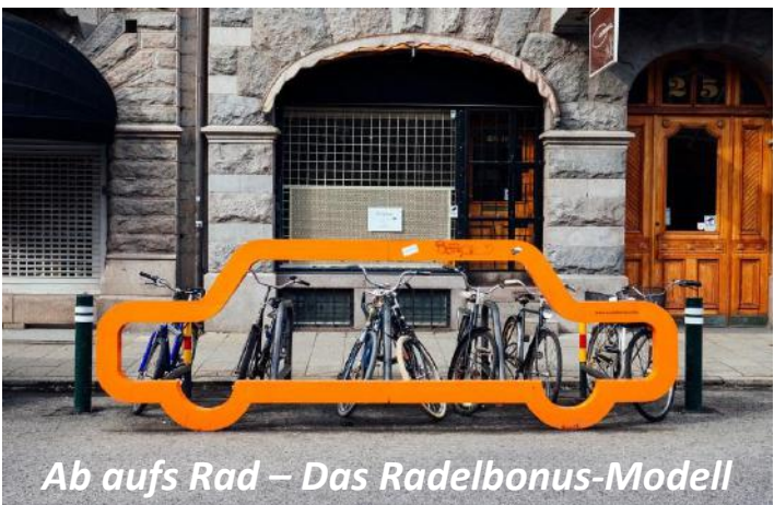
Ab aufs Rad – Das Radelbonus-Modell